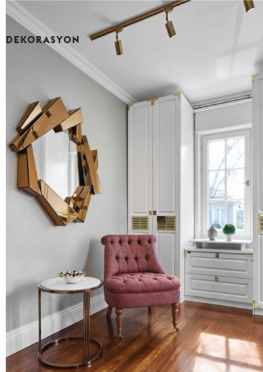
Giyimne odasındaki aynaya Bakara Collection'dan. Bordo koltuk ve yan sehpa özel imalat.