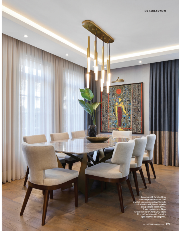
Birinci ayakkı Tando Grey mermer yemek masası özel mobilya. Uzun yemek davetlerinde konforlu dinlenme için sandalyeler geniş kolplu tasarımları. Sakat ayakkılar Bığa Ayakkı/özel/özel. Fırın/özel tablo Havva Marta ya ait. Perdeler için İkonlar ile çalıştık.

çalışabilecek için düğün tarihlerini biraz ertelemek nezaketinde dahi bulundular. Bu da bizi hem çok mutlu etti, hem de titiz bir proje yönetimi için ayrı bir sorumluluk daha yükledi. Dekorasyon çalışmalarını iki yıl önce başladık. Eve ilk girişiminde onun müdürlüğüne oturdular için içeride ve dışarda anarmları ve yenilenmesi gereken çok şey vardı. Ahşap doğramalar, panjurlu pencereler, mutfak ve banyo dolapları yenilendi. Parkeler sökülerek başka seçenekler yapıldı. İtaliye, koridor ve merdivenlerde bulunan tüm mermerler çıkarıldı. Havuz ve genel tesisatlar elden geçirildi. İş mekane ve day bölümüne gerekli inşaatlar yapıldı. Mimar yapı çok iyi planlandı. O nedenle sadece enki kirazların bodrum katta büyük salona bölmek için yaptıkları separatör duvar kaldırıldı. İş mekanları büyütme ve alanları ferah göstermek için mobilya tasarımlarımızın geneli için kul-