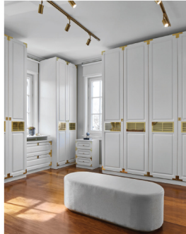
Dağlar ev sahiplerinin ihtiyaçlarına yönelik tasarlanmıştır. Ortadaki duvara foto özel imalat. Spotler Bilge Aydınlatma'dan seçilmiştir.

"DEKORASYON; İÇ YA DA DIŞ MEKANDA BEĞENİLERİN HAYATA GEÇİRİLEBİLDİĞİ, YAŞAM KÜLTÜRLERİNE DAİR BİRÇOK İPUCUNU BARINDIRAN, DUYGULARIN KARŞI TARAFYA AKTARILABİLDİĞİ VE HAYAL DÜNYANIZA GERÇEĞE DÖNÜŞTÜREBİLEN SANATIN BİRTÜRÜDÜR."