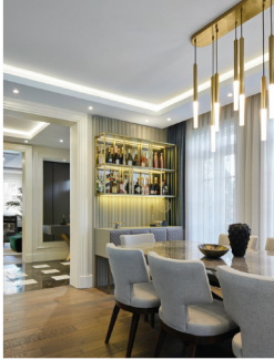
İlgili ağırlık raf, televizyon ünitesi ve bir özel tasarım ve eve özel olarak yapılmıştır.