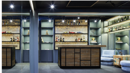
Bodrumdaki büyük salonun bir köşesi bar olarak geniş ev sahiplerinin misafirleri ile beraber keyifli zaman geçirmeleri için sıcak ve samimi bir atmosfer yaratılmak tasarlanmıştır. Tasarım destekleyen mavi koltuklar özel olarak üretilmiştir.